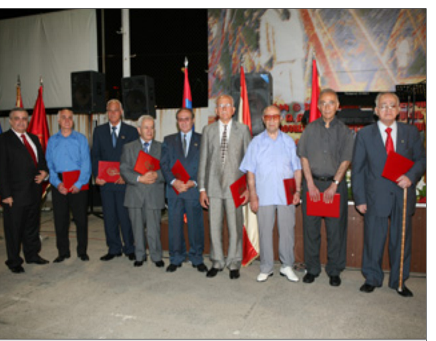
Վկայագիր ստացող ընկերները

Քսաններու ոգեկոչման 93-ամեակի նուիրուած հանիսութեան տեղի ունեցաւ գնահատագիր - վկայականներու բաշխում: Բեմ բարձրացաւ Ա.Գ.Յ. Կուսակցութեան Վարիչ Մարմնոյ